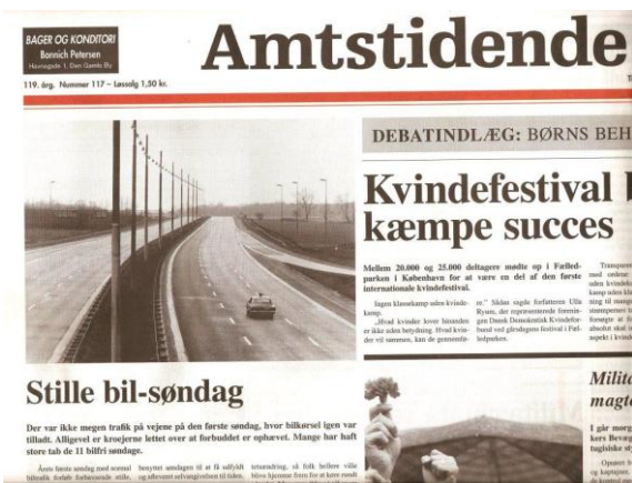
Alle får et eksemplar af 'Amtstidende fra 1974'

Fik du ikke et eksemplar af 'avisen fra 1927' - 8 sider i Politiken format med nutidens typer. ...så har vi ekstra eksemplarer med. → →